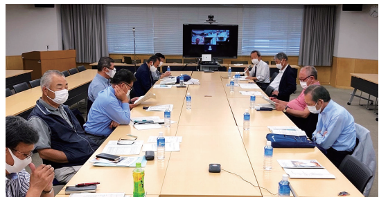
役員会の様子 (オンライン+対面)

したフロンティアクラブの命名の通り、「開拓者精神をいつまでも忘れず、また慣習などにとらわれず進んで新しいことに取り組もう」という熱い思いを受け継いだものとなります。奨学金給付を始め、さまざまな活動が行えるのも会員の皆様の温かいご協力やご支援があるからです。また、さまざまな活動を通してフロンティアクラブを発展させるためには、もっと多くの卒業生に当クラブの存在を知ってもらい、会員になっていただくことが大切と考えます。引き続き、皆様のご理解とご協力を賜りますようお願いいたします。最後にありますが、会員の皆様及びご家族の皆様のご健勝とご多幸を祈念し、私の挨拶といたします。